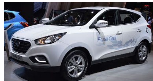
Hyundai ix35 fuel cell

Henk Tiesinga weet dat wethouder Anjo Simonse waterstof hoog op zijn 'bucketlist' heeft staan. Binnen de NNE speelt het thema binnen meerdere werkgroepen