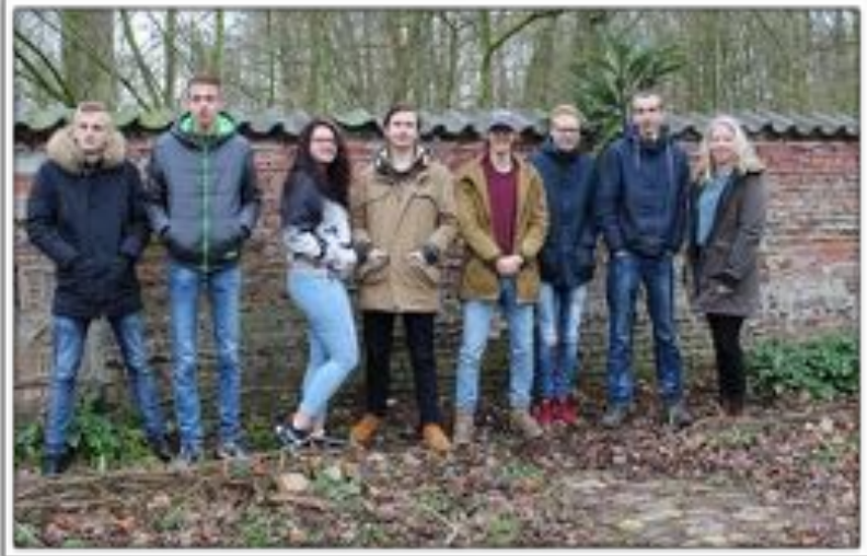
Tweedejaarsstudenten Toegepaste Biologie bij de bijenmuur in het aan te leggen voedselbos.