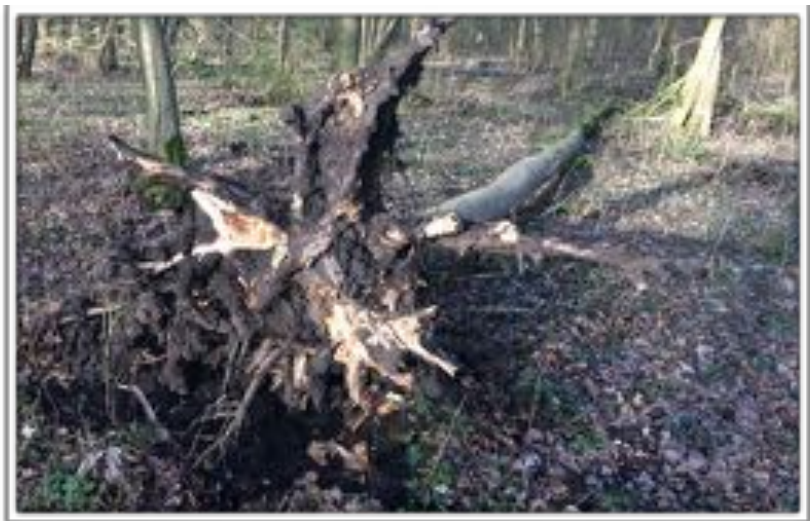
Door essentaksterfte gevælde es.

Voor de aanplant van het voedselbos, moet bestaand bos wijken. Maar dat is een reden temeer waarom er bij de aanvraag van de subsidie gesproken werd over 'het juiste plan, voor de juiste plek, op het juiste moment.'