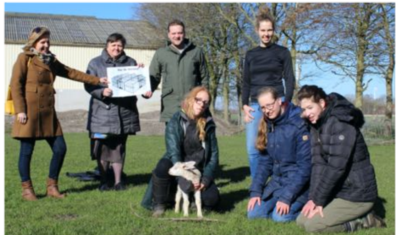
Een duurzame kas bij Zorgboerderij De Bosrand in Tollebeek. Een initiatief van de Stichting Vrienden van De Bosrand.